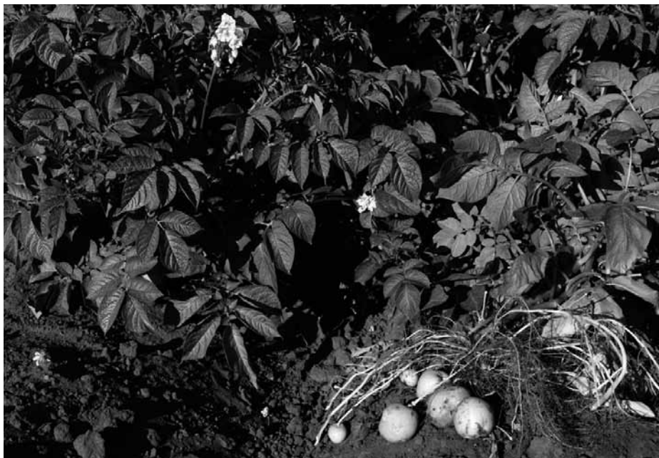
Kartoffelpflanze mit gesundem Kraut

Inzwischen haben holländische Forscher_innen neue Kartoffeln geschaffen, in die mehrere Resistenzgene von wilden Kartoffeln eingebaut worden sein sollen. Wir haben weder das Wissen noch Lust, uns in diese ewigen Expert_innendebatten über die möglichen besseren Eigenschaften dieser neuen Schimären einzumischen. Da jedoch das tatsächliche Projekt hinter der Gentechnik ist, die Landwirtschaft noch produktivistischer zu gestalten, kann die Hypothese aufgestellt werden, dass die gleichen Ursachen weiterhin die gleiche Wirkung haben werden. Man kann sich also fragen, was passiert, wenn grosse Kulturen von Superkartoffeln mit mehreren Re-