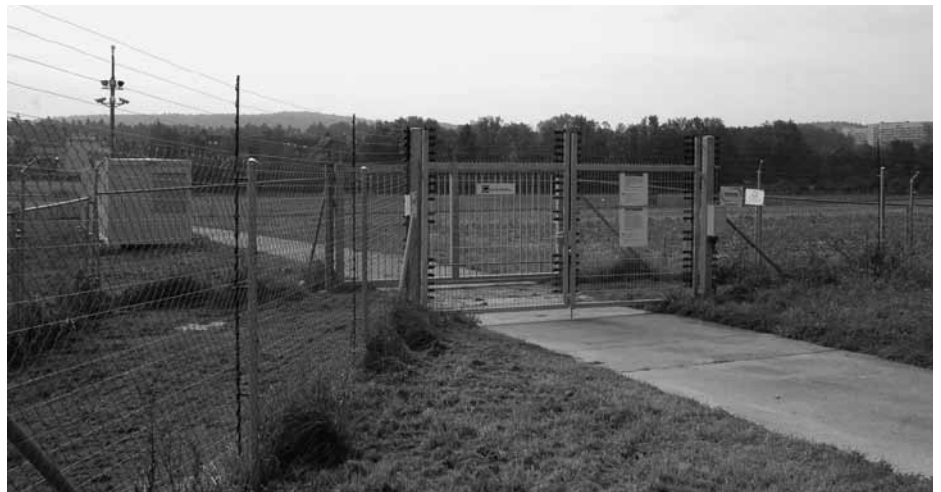
Eingangstor der Protected-Site in Reckholz Zürich

schaffen und erhalten diese Pflanzen eine Abhängigkeit und damit auch die Herrschaft über diejenigen Menschen, die sie anbauen. Wenn mensch sich vor Augen hält, dass sich diese Unternehmen und Forschungseinrichtungen (beinahe) ausschliesslich in den Ländern des Nordens befinden, wird schnell klar, dass dieses Abhängigkeitsverhältnis hier einer imperialistischen Logik folgt. Auch nach 25 Jahren, in denen an GVO geforscht wird, erzählt man uns noch davon, dass die Gen-